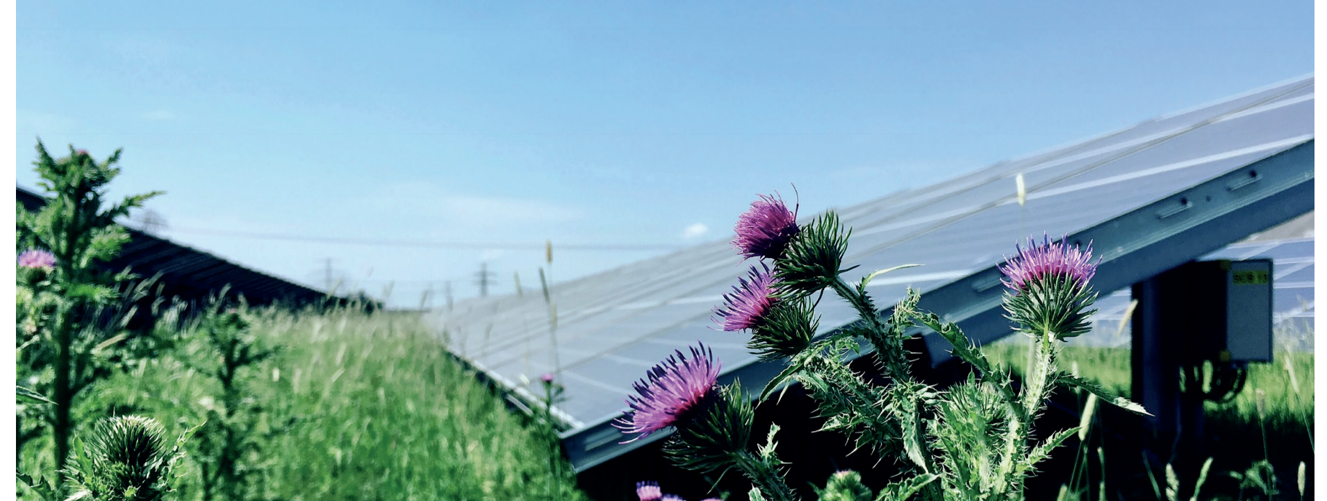
Foto zonnepark Vierverlaten. Bij de ontwikkeling van zonneparken in de gemeente Groningen wordt er nadrukkelijk gekeken naar een goede mix met ecologie.